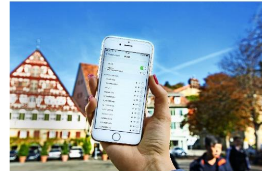
Noch ist kostenloses WLAN in der Esslinger Altstadt ein Traum.

Der Gemeinderat soll demnächst über einen kostenfreien Internetzugang innerhalb des Altstadtrings entscheiden. Die Begeisterung hält sich in Grenzen.